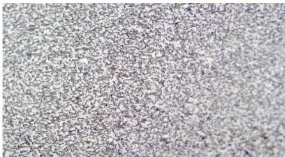
Рис. 2. Микроструктура горячекатаной арматуры №12 класса А500С

Как видно из микроструктуры горячекатаной арматуры, что край и середина горячекатаной арматуры №12 класса А500С имеют феррито-перлитную структуру.