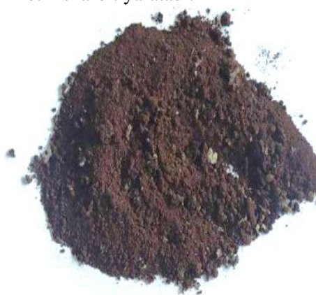
1-rasm. Vodorod bilan tiklash uchun tayyorlangan po‘lat eritish changidan olingan namuna

Changning yuqori dispersligi va g‘ovak tuzilishi vodorod bilan reaksiyaga kirishish uchun qulay kinetik sharoit yaratadi.