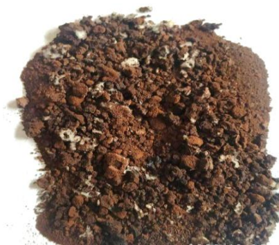
2-rasm. Vodorod yordamida tiklash natijasida olingan namuna

Vodorod bilan tiklashning muhim afzalliklaridan biri — temir oksidlarini rux oksidiga nisbatan selektiv tiklash imkoniyatidir, ya'ni, FeO → Fe (tiklanadi), ZnO → Zn (yuqori haroratda bug'lanadi, qayta kondensatsiyalanadi). Bu holat ruxni alohida yig'ib olish va temirni metall holatda konsentrlash imkonini beradi.